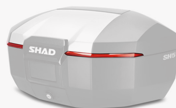
Catadiottri rosso D1B511CAR