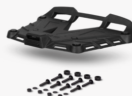
Piastra alluminio nero D1BTRPA2