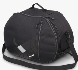
Borsa interna X0IB10 X35 Y50 Z21 (cm)