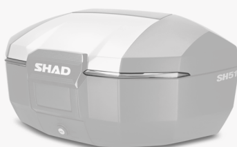
Catadiottri bianco D1B512CAR